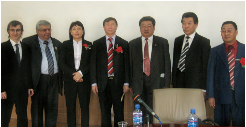
Фото на память перед конференцией