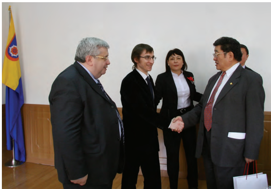
Когда еще придется познакомиться с президентом государства. Проф. П. Очирбат и К. Кириллов