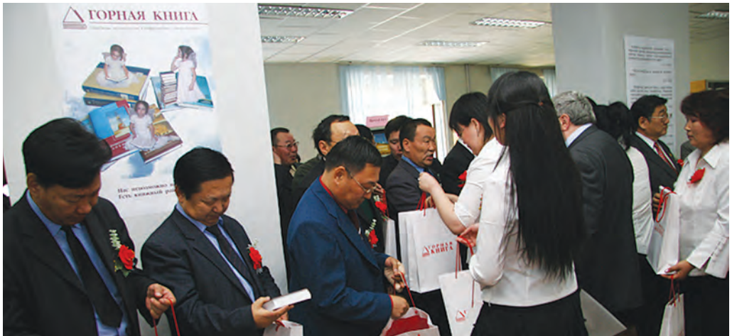
Заинтересованные посетители на выставке