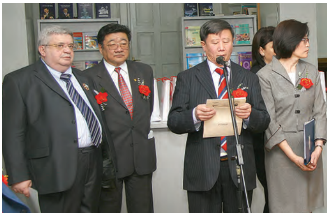
Выставку открывает ректор МГУНТ проф. Б. Дамдинсүрэн