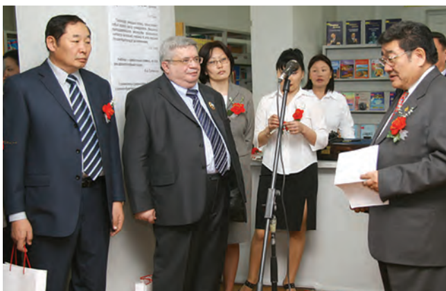
Выступает первый президент Монголии проф. П. Очирбат