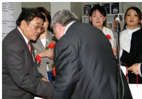
Первый президент Монголии г-н П. Очирбат читает лекции в МГУНТ. Наш визит, благодаря ему, стал государственным