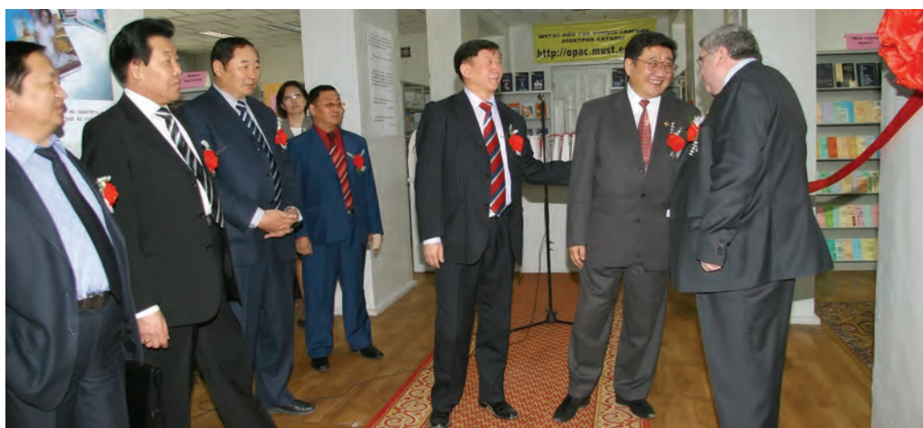
Обмен любезностями у микрофона