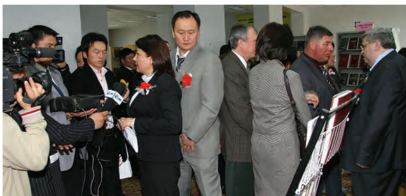
Суматоха первого дня: делегации, посетители, ТВ, газеты. Были даже журналисты из Китая