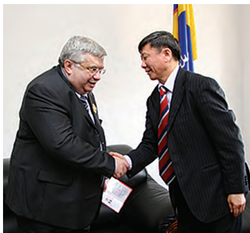
Награждение орденом «Слава учителя». Поздравления ректора