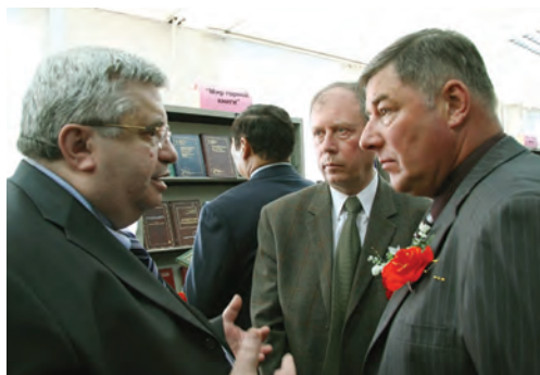
Сотрудники посольства России в Улан-Баторе приняли живое участие в работе выставки. Они оказались неравнодушны к учебной литературе