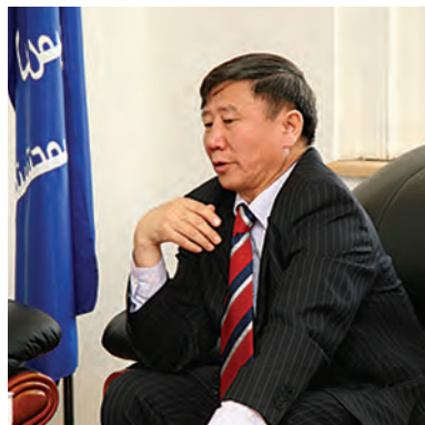
Знакомство с ректором МГУНТ проф. Б. Дамдинсурэном