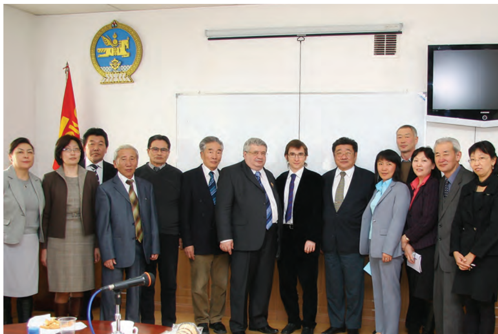
Встреча с учеными-горняками. Все отлично говорят по-русски