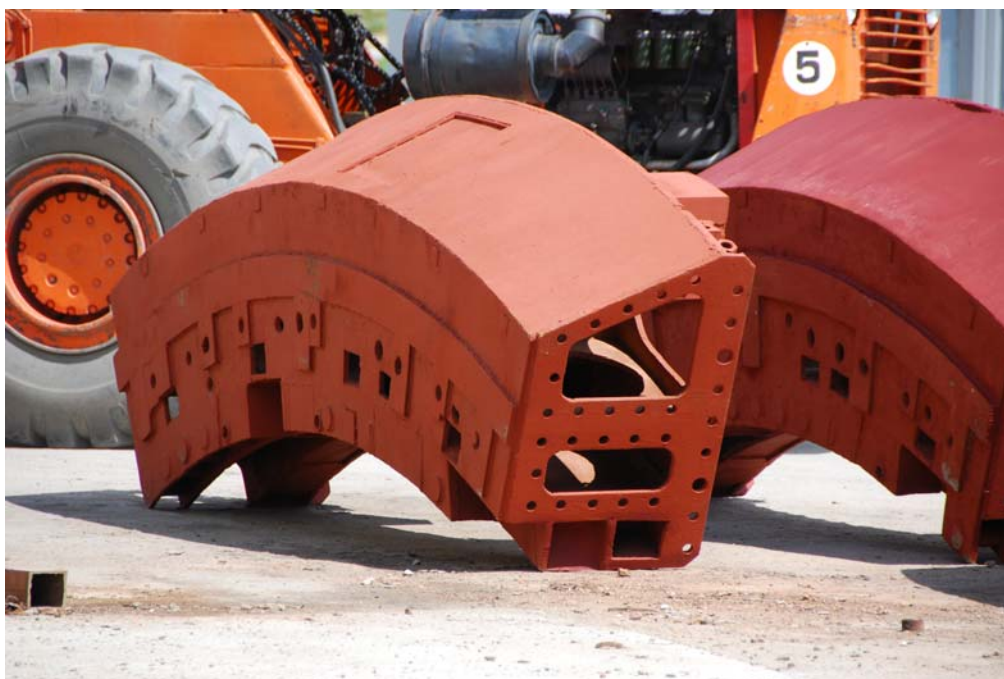
Рис. 1. Сегмент монтажного кольца

монтажа всего кольца срезаются за-подлицо с плоскостью тубингового кольца. На верхнюю обработанную плоскость тубингового кольца выставляются горизонтальные прокладки. Монтажное кольцо с собранным на нем тубинговым кольцом с помощью шести 25 тонных домкратов (Рис.2) поднимается на 100 мм к ранее установленному тубинговому кольцу и закрепляется на болтах к забетонированному кольцу тубингов. Такой способ подвешивания колец тубинговой крепи позволит собирать все кольца на одной и той же базе болтовых отверстий с одной и той же точностью всех отклонений, то есть с точностью изготовления кольца 1500^{+0,1} мм.