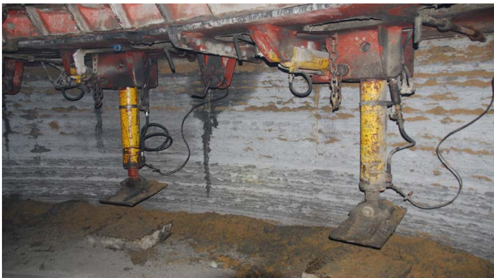
Рис. 2. Домкраты для монтажного кольца

работ, механизированную установку и точную сборку тубинговых колец, индустриальный метод качественного заполнения литой бетонной смесью затубингового пространства.