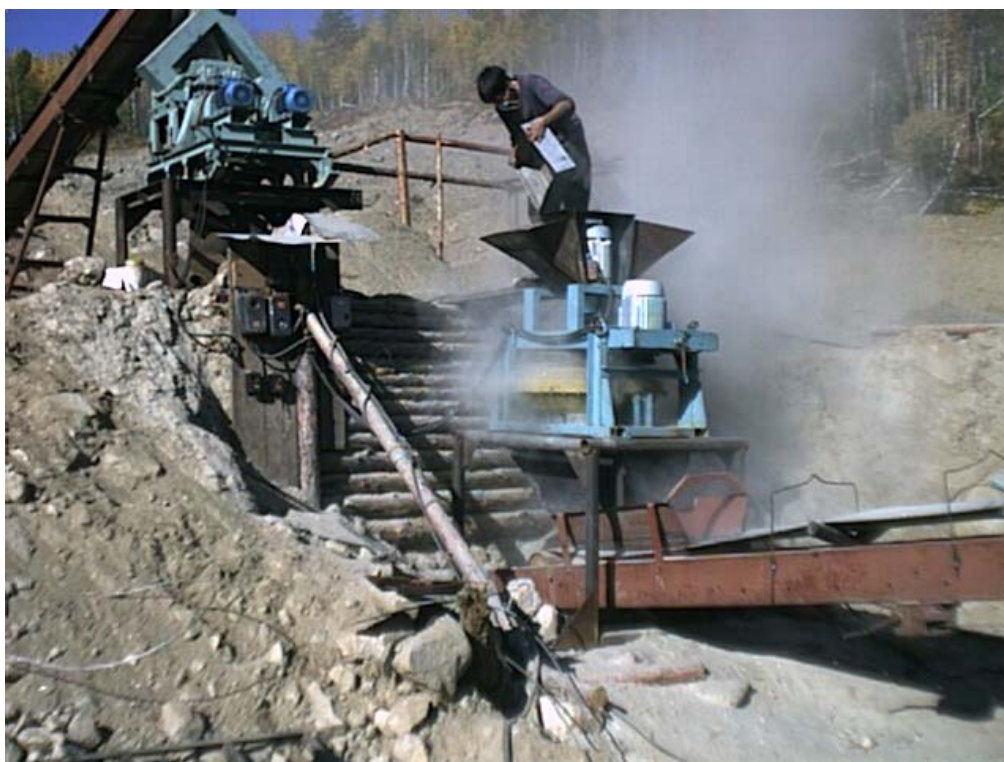
Рис. 1. Выброс тонкодисперсной пыли при работе мельницы ЦМБУ-800 в открытом режиме

пыли (после пылеулавливающего циклона и на разгрузке мельницы) практически одинакова. Тогда как при работе центробежной мельницы в открытом режиме концентрация пыли на разгрузке мельницы выше, более чем в два раза, чем на пылеулавливающем циклоне. Таким образом, видно, что установка дополнительно-