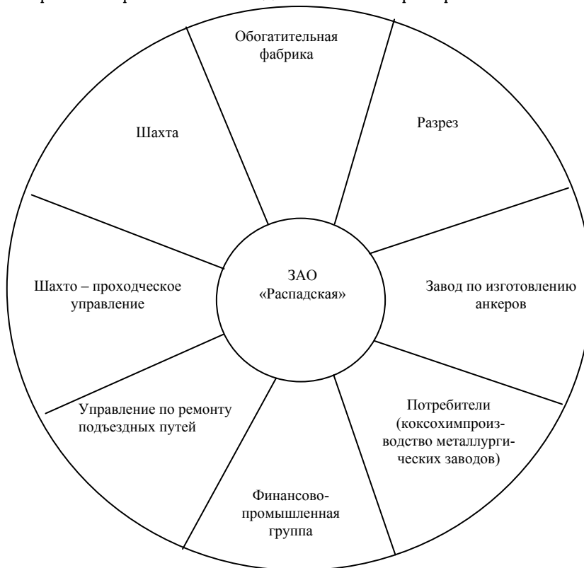
Типовая структура кластера по добыче угля в ЗАО «Распадская»

бортов горных выработок из водостойкой фанеры ПФ.