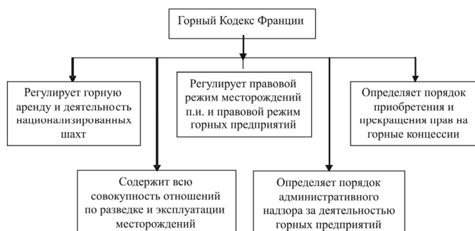
Рис. 3. Основные положения Горного Кодекса Франции

ния, возникающие в каждом виде пользования недрами [5].