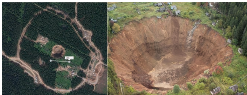
Рис. 1. Провал в Соликамске