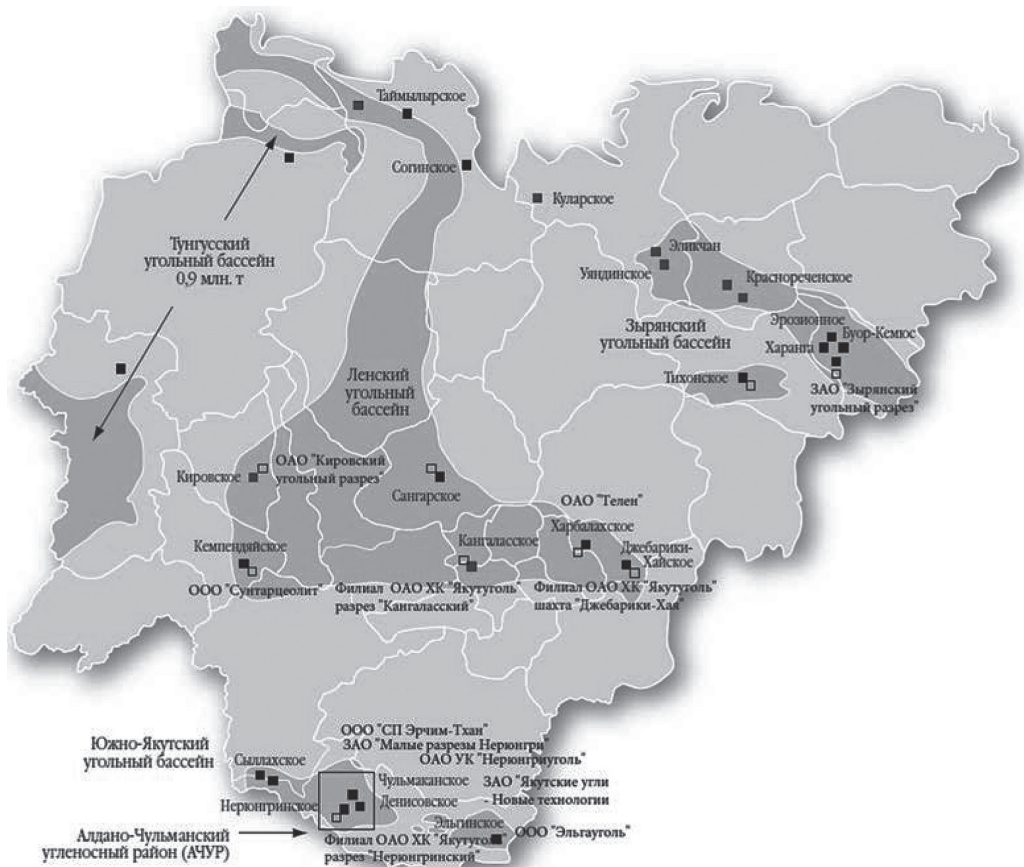
Рис. 1. Карта основных месторождений угля и угледобывающих предприятий Республики Саха (Якутия)