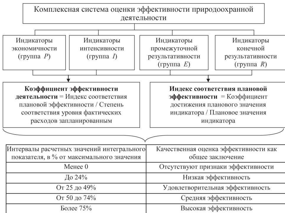
Методика комплексной оценки эффективности деятельности в сфере природопользования Procedure of integrated estimation of efficiency in nature management

по образованным группам индикаторов. Помимо оценки степени достижения индикаторами эффективности природопользования плановых и целевых значений целесообразно проводить оценку во взаимосвязке с уровнем расходов. Критерием оценки показателей (показателей качества управления расходами (ресурсами), показателей интенсивности деятельности, показателей непосредственных результатов, показателей конечных результатов) по данному направлению считается соответствие достигнутых значений этих показателей их плановым или целевым значениям (рисунок).