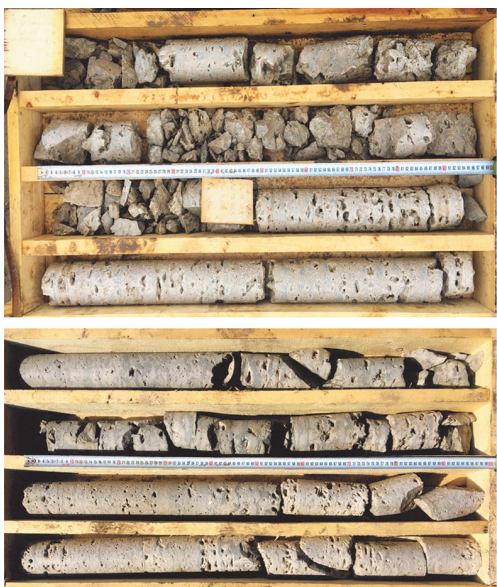
Рис. 2. Целевые коллекторы нижнекембрийского водоносного комплекса Fig. 2. Target reservoirs of Lower Cambrian aquifer

Использование толщи ММП для закачки также было реализовано в процес-