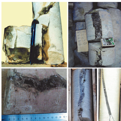
Рис. 1. Целевые коллекторы толщи ММП Fig. 1. Target reservoirs of permafrost

Процесс формирования полезной емкости такого типа коллекторов рассмотрен в работах С.В. Алексева, Ф.Г. Атрощенко, А.В. Дроздова, В.В. Лобанова, А.М. Янникова и др. [4, 5 и др.].